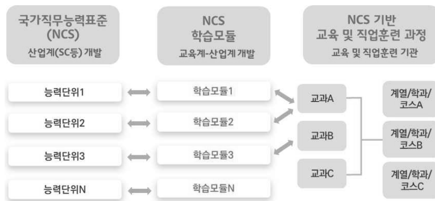
그림 2. NCS 학습모듈 개념도(교육부, 한국직업능력개발원, 2017, p.6)

구체적으로 NCS학습모듈은 NCS 능력단위와 정합성을 갖는다. <그림 2>와 같이 NCS 학습모듈의 명칭은 NCS의 능력단위명, 학습모듈의 목표는 NCS의 능력단위 정의, 학습모듈의 학습명은 NCS의 능력단위 요소명을 사용한다(교육부, 한국직업능력개발원, 2017). 학습모듈에서 학습 내용의 학습 목표는 NCS의 능력단위 기술서에 제시된 수행준거에 준하여 사용한다. 학습모듈의 학습 내용(필요 지식, 수행 내용, 재료·자료, 기기(장비·공구), 안전·유의 사항, 수행 순서, 수행 팁)은 NCS의 능력단위 기술서에 제시된 지식, 기술, 태도를 참고하고 학습모듈의 교수·학습 방법은 NCS의 적용 범위 및 작업 상황을, 학습모듈의 평가는 NCS의 평가 지침을 활용한다. 능력단위별로 학습모듈을 개발하는 것을 원칙으로 하되 NCS가 세분류(직무)를 단위로 개발되는 것과 달리, 학습모듈은 능력단위별로 개발된다는 것에 유의해야 한다. 또한 능력단위와 학습모듈은 1:1, N:1, 1:N 등 다양한 방식으로 구성될 수 있기 때문에 각 전공별 교육과정과 학습모듈을 구성하는 데에 있어 특수한 성격을 반영하기 쉽고 계열, 학과, 과정에 따라 조정이 가능할 수 있는 이점이 있다. 결과적으로 대학 무용학과 문화예술교육사 자격 인정 전공교과를 지도함에 있어서도 직무역량, 예술전문성 교과목의 능력단위를 추출하고 이에 따라 학습모듈을 적용한다면 다양한 수업모형과 학습모듈의 적용이 가능할 수 있다.